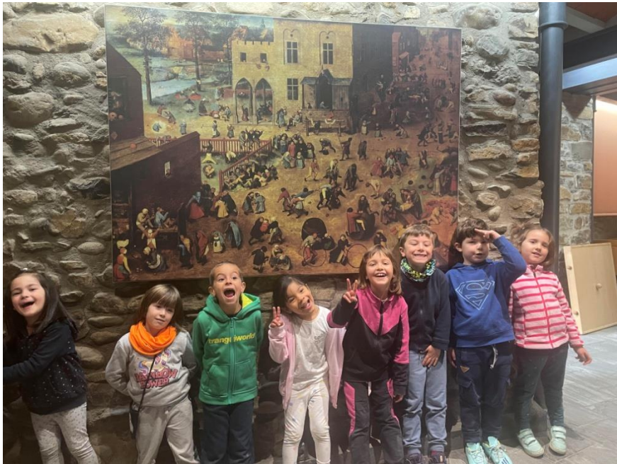
Los niños y niñas de 5 años y 1º de Educación Primaria

Es un museo muy divertido y nos gustaría que todos los niños fuesen para conocer los juegos tan antiguos y especiales que hay allí. Y lo mejor de todo es... ¡Que está en Campo!